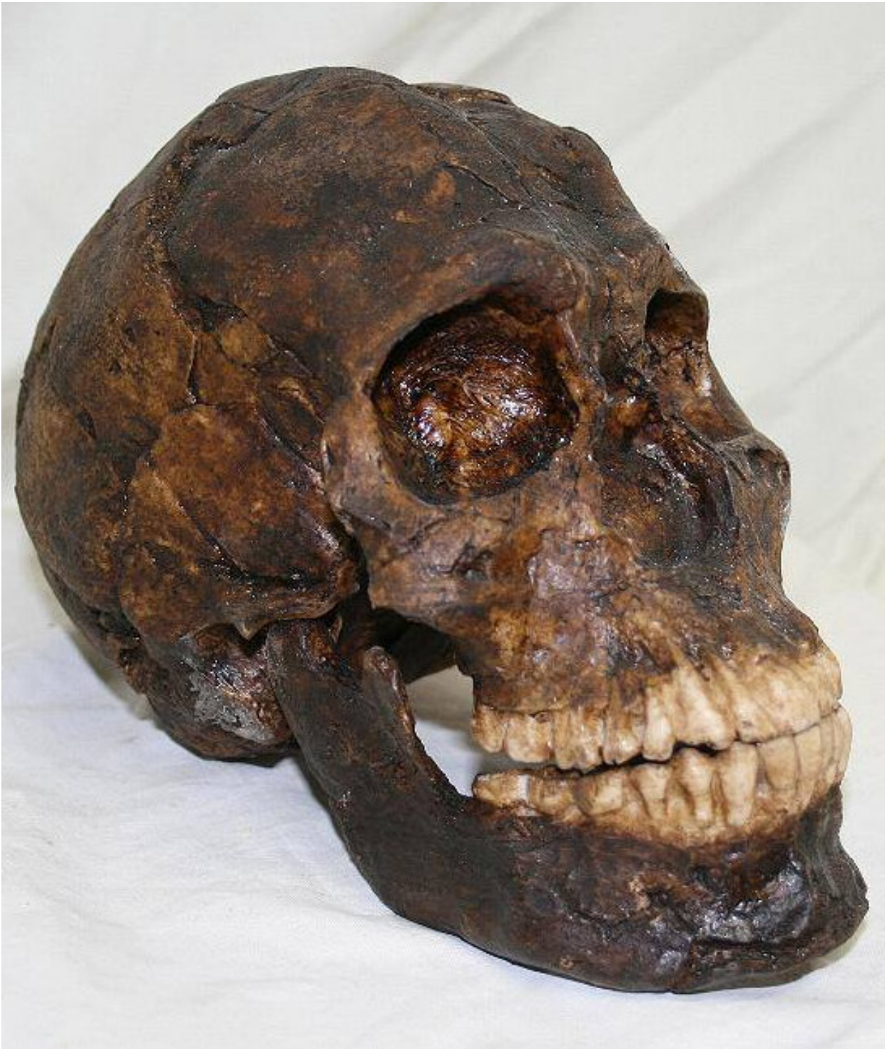
Homo sapiens sapiens