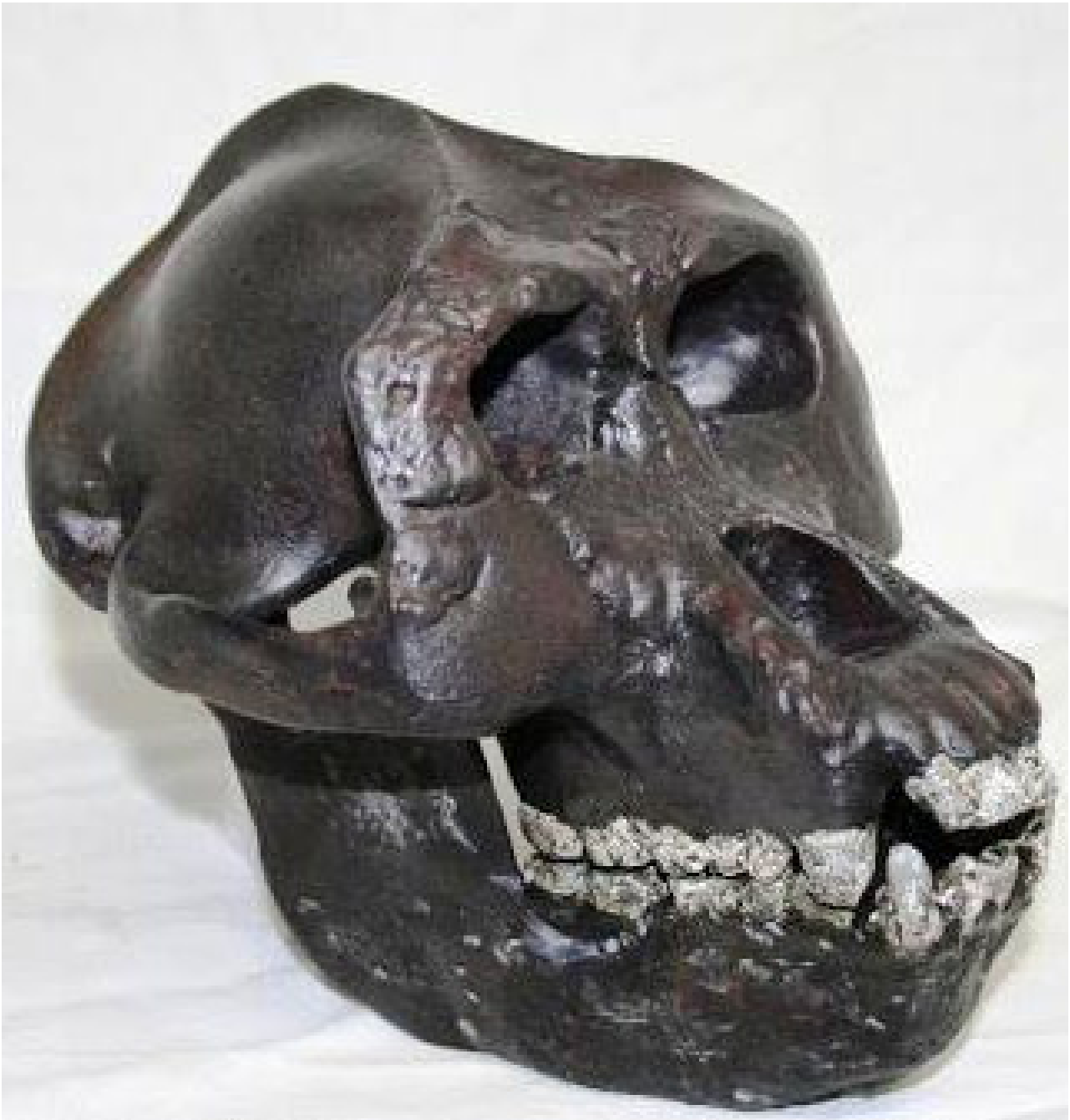
Sivapithecus sp. (maschio)