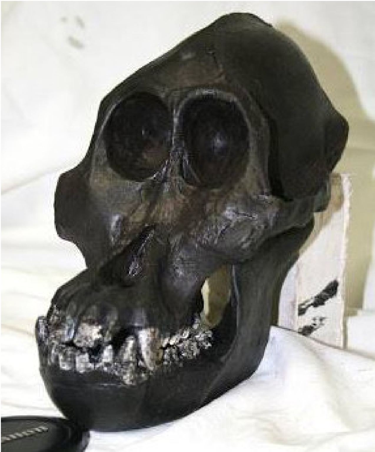
Sivapithecus sp. (femmina)